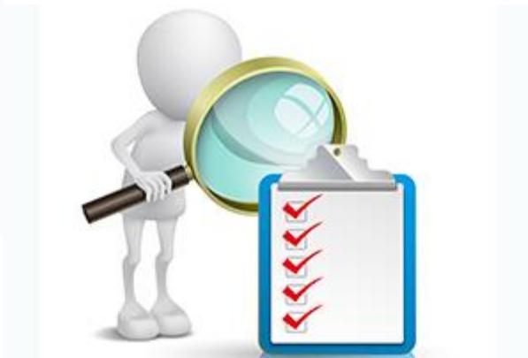
Auditi (iekšēji, ārēji)